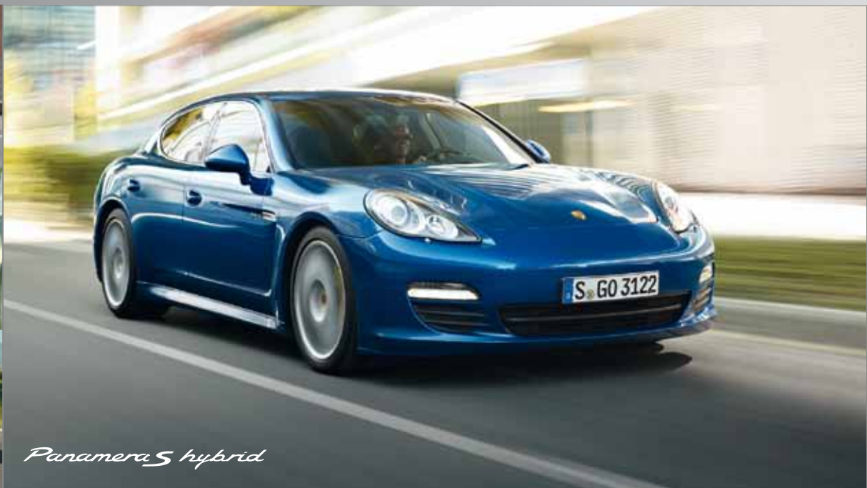
Panamera S hybrid

Sportlichkeit und Effizienz: ergibt Fahrspaß für vier.