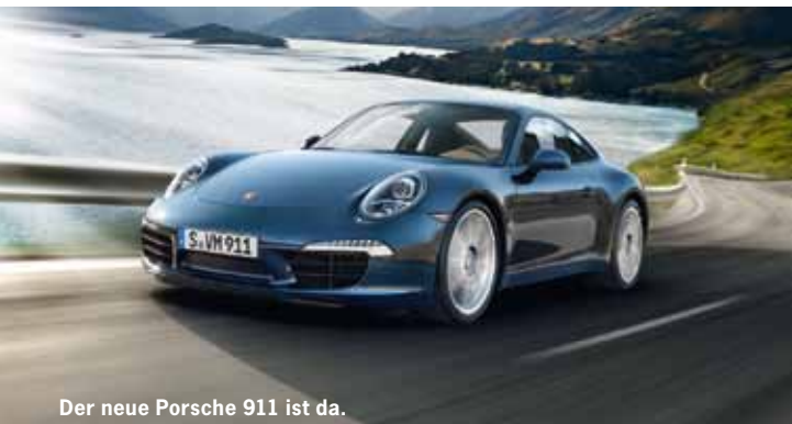
Der neue Porsche 911 ist da.