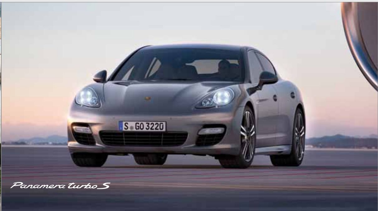
Panamera turbo S